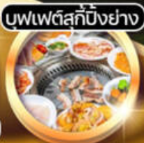
บุฟเฟ่ต์สุกี้ปungย่าง