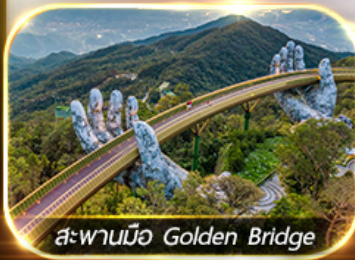
สะพานมือ Golden Bridge