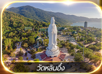
วัดหลินอึ้ง