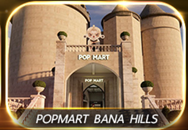
POP MART BANA HILLS

สัมผัสความงามหมู่บ้านฝรั่งเศสที่บานาฮิลล์ ช้อปปิ้ง POPMART