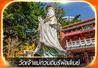
วัดเจ้าแม่กวนอิมทิฟลัสเบย์

รวมตั๋วดิสนีย์แลนด์+รถรับ-ส่ง ซอปปิงแบบจัดเต็ม พักย่านจิมซาจุ่ย