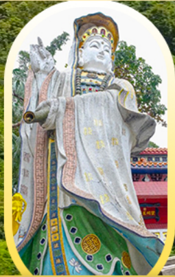
วัดเจ้าแม่กวนอิมรี พลัสเมย์