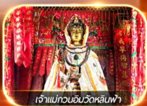
เจ้าแม่กวนอิมวัดหลินฟ้า