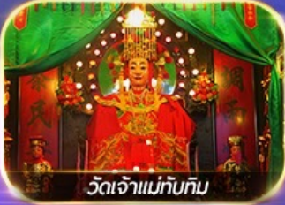
วัดเจ้าแม่ทับทิม

รวมตั๋วดิสนีย์แลนด์+รถรับ-ส่ง ซอปปิงแบบจัดเต็ม พัทยานิมิตต์ชาจู้ย