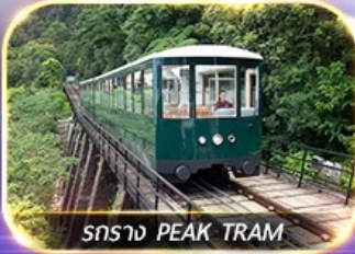
รถราง PEAK TRAM