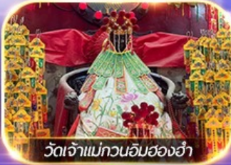
วัดเจ้าแม่กวนอิมฮ่องกง