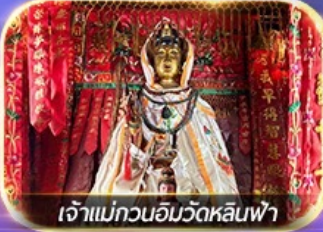
เจ้าแม่กวนอิมวัดหลินฟ้า