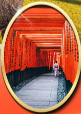
Fushimi Inari Shrine

รหัสทัวร์ RJ-XJ139 เดินทาง 5D 3N ท.ย. - ต.ค. 2569