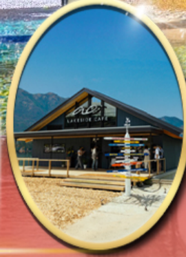
Ao Lakeside Cafe