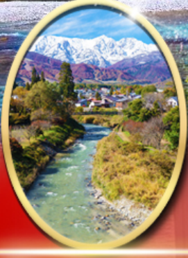
โออิดะพาร์ค