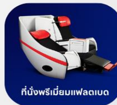
ที่นั่งพรีเมียมแพลตฟอร์ม