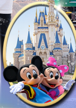
อิสระเลือกซื้อบัตร Tokyo Disneyland