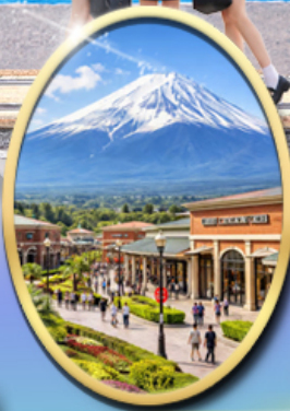
Gotemba Premium Outlets