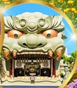
ศาลเจ้านิมบะ ยาชากะ