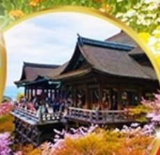
วัดคิโยมิสึ