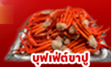
บุฟเฟ่ต์ขาปู

พักผ่อนไม่1คืน | พักทาคายามา1คืน พักฟูจิ1คืน | ออนเซ็น3คืน