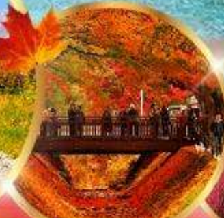
อุโมงค์เมเปิ้ล