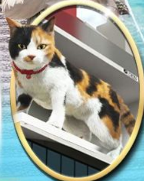
ซัปโปริง ชินจูกุ