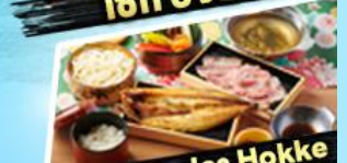
เซ็ทซาซุ + ปลา Hokke