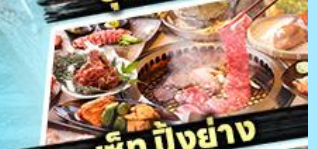
เซ็ท บิงย่าง