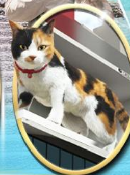
ซอยบิจิ ซินจุกุ