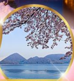
ทะเลสาบไทยะ