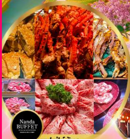
บุฟเฟ่ต์นันทะ ซาปู 3 ชนิด+ ซึฟู้ด + วาทิวA5