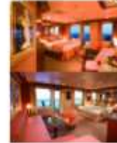
Floor Diagram Grand Suite Sleeps up to 4 10 Cabins Cabin: 436 sqft (41 m 2 ) * Size may vary, see details below.