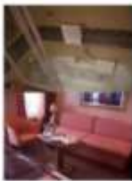
Floor Diagram Mini-Suite Sleeps up to 2 18 Cabins Cabin: 246 sqft (23 m 2 ) * Size may vary, see details below.