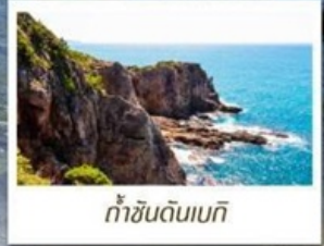
ท้ำซันดินเบกิ

🧳 โหลด 23 KG. x2 ( รวม 46 KG. ) ทั้งไป - กลับ