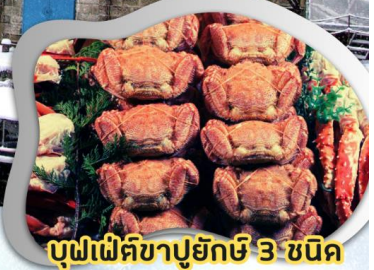
บุฟเฟ่ต์ชาปูยักษ์ 3 ชนิด

บิน Full service สายการบินไทย น้ำหนักกระเป๋า 25 กก.**เที่ยวเต็มทุกวัน อาหารครบทุกมื้อ**