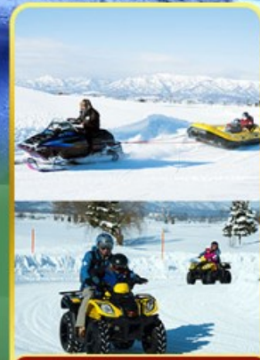
BIBAI SNOW LAND