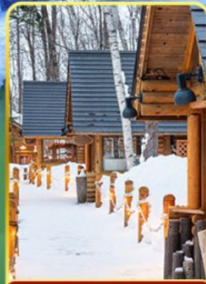
นิงเกิ้ลเคอโร