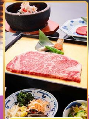
บุฟเฟ่ต์ ROKKASEN

ออนเซ็น 2 คั้น นน.กระเป๋า 23 กก. 7Days 4Night