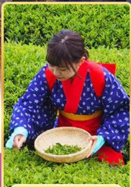
กิจกรรมเก็บชา