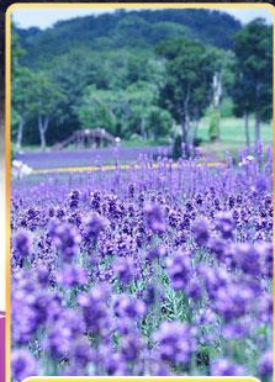
ทุ่งลาเวนเดอร์ทามบาระ