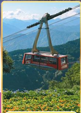
นั่งกระเช้าชูซาวาโคเอ็น