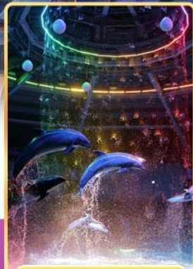
อควาพาร์ค ซินางาวะ