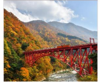
รถไฟชมวิวยุเมงาคุโรเนะ