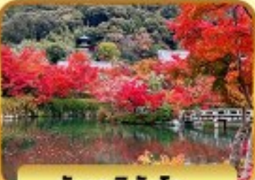
วัดเออิทังโด