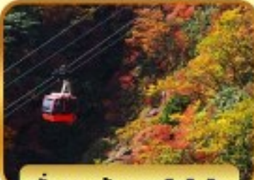
นั่งกระเช้าภูเขาโทโชไซ