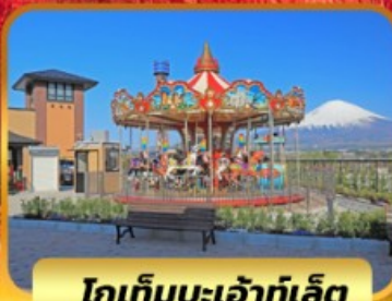
โกเท็มบะเจ้าท์เล็ด