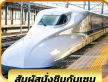
สัมผัสนั่งชินกันเซน