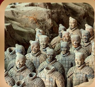
“สุสานจิ้นซีฮ่องเต้”