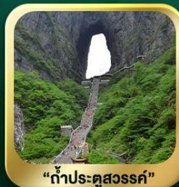
"กำแพงประตูสวรรค์"