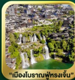
"เมืองโบราณฟูหลงเจิน"