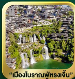
"เมืองโบราณฟูหรงเจิ้น"