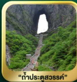
"กำประตูล่องเรือ"