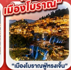
“เมืองโบราณฟู่หลงเจิ้น”