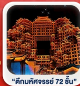
“ตึกมหัศจรรย์ 72 ชั้น”