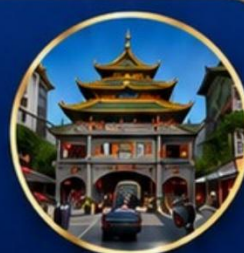
ถนนเปยจิงสู๋ หรือถนนคนเดินปักกิ่ง