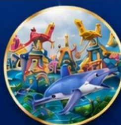
สวนสนุกกลางหลง โอเชียน คิงดอม