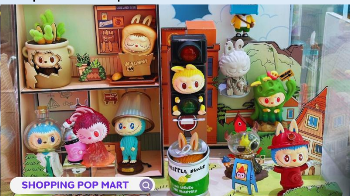
POP MART ช้อปปิงถนนหนานจิง