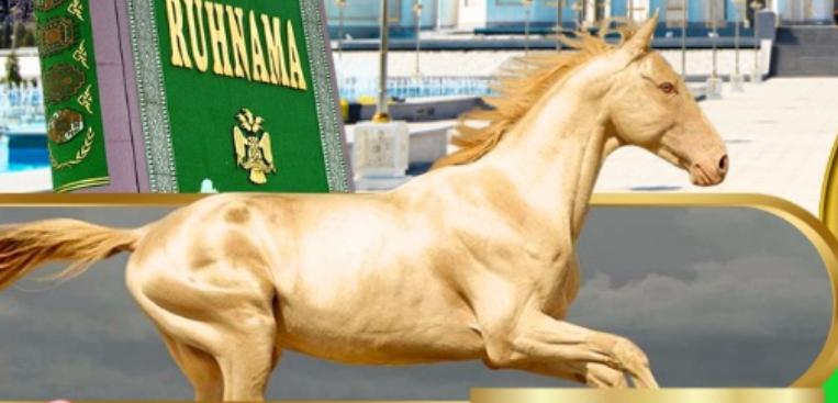
Akhal Teke Horse