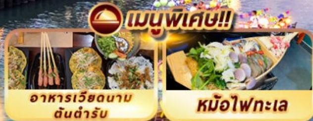
อาหารเวียดนาม ต้นตำรับ