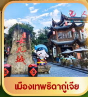
เมืองเทพริดาตุ๋เจี๋ย