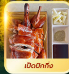
เปิดปอกกิ้ง