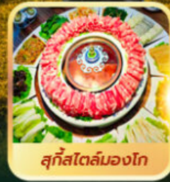
สุกีสโตล์มองโก