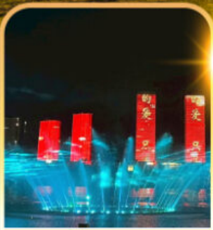
น้ำพุคังบาซี