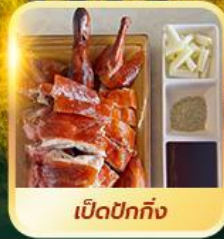
เบ็ดปักกิ้ง