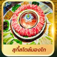
สุกีสโตล์มองโก