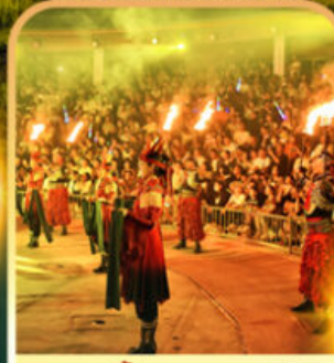
งานเลี้ยงรอบกองไฟ