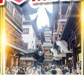
เจียงหวงเมี่ยว