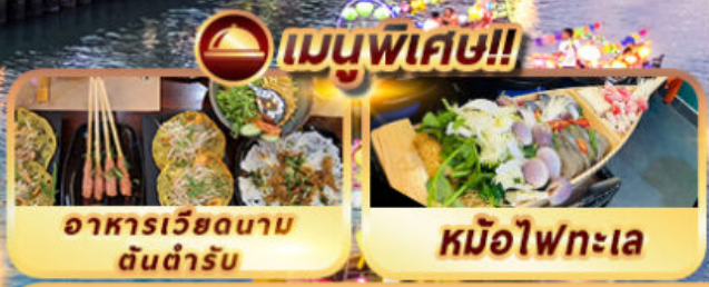
อาหารเวียดนาม ดันตำรับ