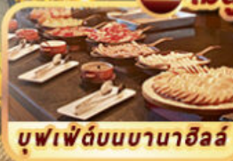
บุฟเฟ่ต์บนบานาฮิลล์