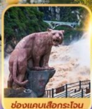
ช่องแคบเล็องกระโจน