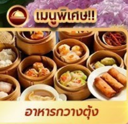
เมนูพิเศษ!! อาหารกวางตุ้ง