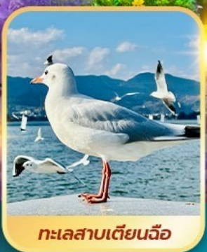
ทะเลสาบเตียนจื่อ