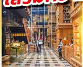
ร้านไอศกรีมมียาฮารา