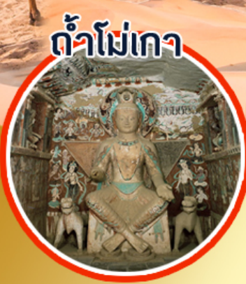
ถ้ำโพ่เกา