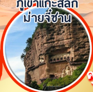
ภูเขาแกะสลัก ม้ายจีซาน