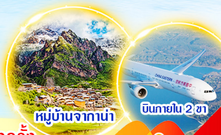
หมู่บ้านจาก่าน่า