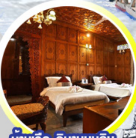
บ้านเรือ..วิมานบนดิน