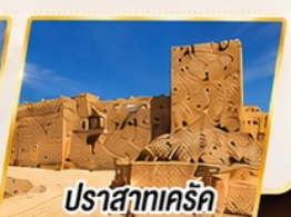
ปราสาทครีค