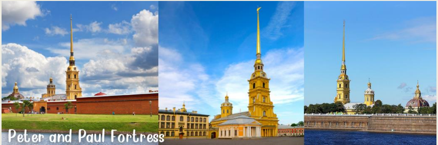
Peter and Paul Fortress

กลางวัน 📍 รับประทานอาหาร ณ ภัตตาคารท้องถิ่น นำท่านชม บ้อมปีเตอร์ แอนด์ ปอลด์ (Peter And Paul) เป็นสิ่งก่อสร้างแรกสุดของเมือง St Petersburg สร้างในปีค.ศ 1703 เป็นอนุสรณ์ชัยชนะสงครามเหนือสวีเดน ด้วยศิลปะแบบบารอกเพื่อใช้เป็นบ้อมปราการในการป้องกันข้าศึกกรุกราน ตั้งอยู่บน เกาะวาซิลเยฟสกี (Vasilievsky Island) ลักษณะเป็นรูปทรงหกเหลี่ยม กำแพงเป็นหินก่ออิฐ ส่วนวิหารปีเตอร์ แอนด์ ปอลด์ (Peter-and-Paul-Fortress) เริ่มสร้างขึ้นเมื่อปีค.ศ 1712 ด้วยการ ออกแบบของ DomennicaTrezzini สร้างเสร็จในวันที่ 29 มิถุนายน ค.ศ 1733 ตั้งชื่อวิหารแห่งนี้เพื่อเป็นเกียรติแด่นักบุญปีเตอร์ และนักบุญปอลด์เพื่อเป็นการเผยแพร่ศาสนา ความสูงของยอดแหลมคือ 122.5 เมตร ในอดีตเป็นสิ่ง ก่อสร้างที่สูงที่สุดของเมืองและห้ามสร้างสิ่งก่อสร้างใดสูงกว่า ภายในทำการตกแต่งด้วยศิลปะบารอกซึ่งนับว่าแตกต่าง กับโบสถ์คริสต์ออร์ทอดอกซ์ทั่วไปและวิหารแห่งนี้ยังเป็นที่เก็บพระศพของราชวงศ์โรมานอฟ เริ่มต้นจากพระเจ้าปีเตอร์มหาราชเป็นองค์แรก จนกระทั่งถึงกษัตริย์องค์สุดท้ายของราชวงศ์