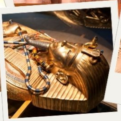
พิพิธภัณฑ์สถานแห่งชาติอียิปต์