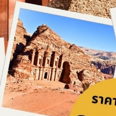
เพตรา นครศิลาสีชมพู