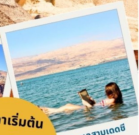
ทะเลสาบเดดซี