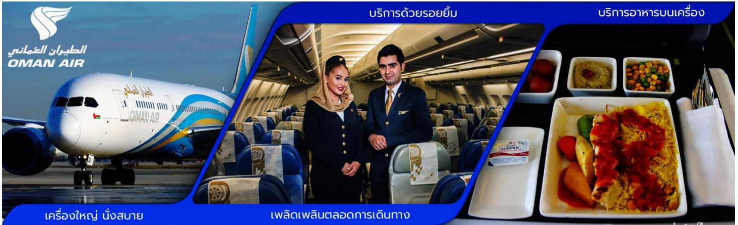
เครื่องบิน นั่งสบาย

06:00 น. คณะผู้เดินทางพร้อมกัน ณ สนามบินสุวรรณภูมิ อาคารผู้โดยสารขาออกระหว่างประเทศ ชั้น 4 ประตูทางเข้าที่ 6-7 แถว M เคาน์เตอร์สายการบินโอมาน แอร์ ซึ่งมีเจ้าหน้าที่บริษัทฯ คอยให้การต้อนรับพร้อมอำนวยความสะดวกด้านสัมภาระแก่ท่าน