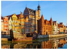
เมืองกตังส์