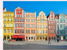
เมืองวรอดซวาฟ