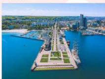
เมืองกดีเนีย