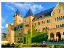
ปราสาทอิมพีเรียล

** พักที่ Vivaldi Hotel 4* หรือเทียบเท่า **