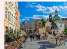
เมืองคราคูฟ

** พักที่ Golden Tulip Krakow Kazimierz Hotel 4* หรือเทียบเท่า **