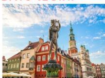
เมืองโปซัน