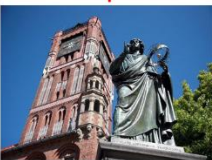
เมืองโตรุน

DAY3 โตรุน-มาลบอร์ก-ปราสาทมาลบอร์ก-กตังส์