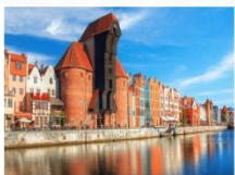
เมืองกตังส์