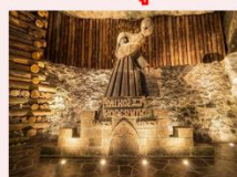
เหมืองเกลีอวิลิชก้า