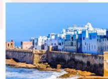
เมืองเอสซาออูรา

DAY10 เอสซาออูรา-เมืองเก่า-ท่าเรือเอสซาออูรา-กำแพงเมืองคาซาบลังกา (โมร็อกโก)