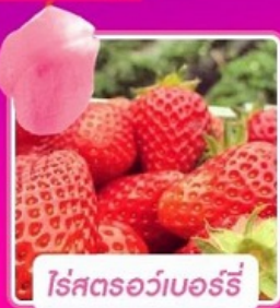
โรสตรอว์เบอร์รี่

เริ่มเดินทาง 01 มี.ค.-30 มิ.ย. 2567 บินโดย Jeju Air JEJUair น้ำหนักกระเป๋า 20 Kg.