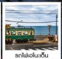
รถไฟเอโนะเด็ง