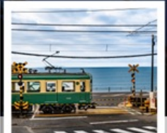
รถไฟเอโนะเด็ง