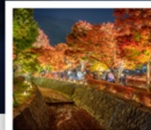
อุโมงค์เมบิล