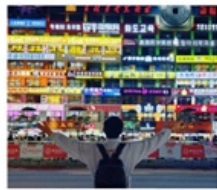
กำแพงมหาวิทยาลัยเหยียนเปียน