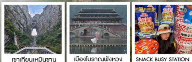
เขากียนเหมินซาน