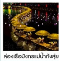
ล่องเรือมังกรแม่น้ำก้งซุย